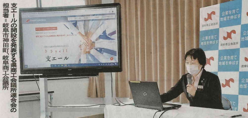
支エールの開設を発表する県商工会議所連合会の担当者。岐阜市神田町、岐阜商工会議所